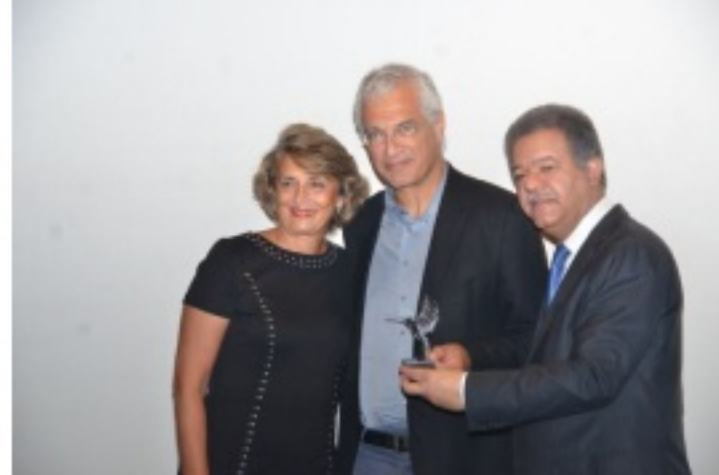
(+) Click para ampliar