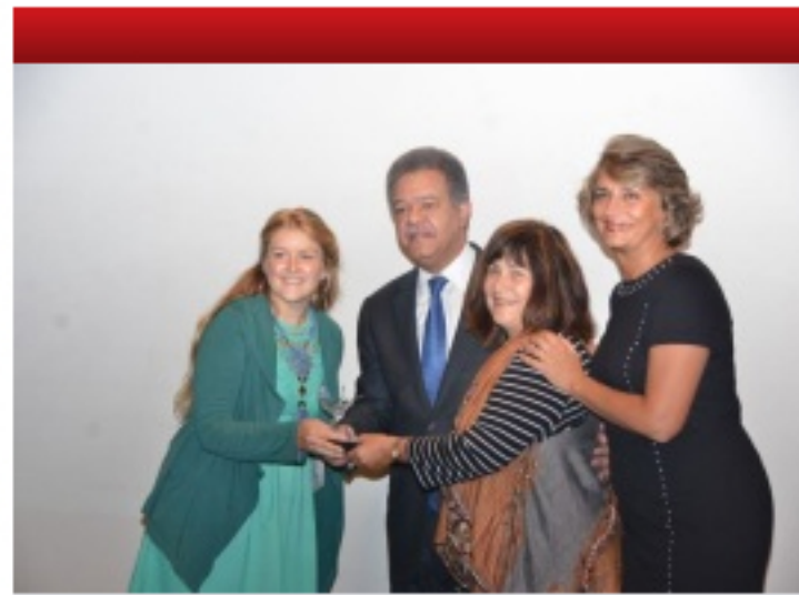
(+) Click para ampliar

Me gusta Compartir A 9 personas les gusta esto.